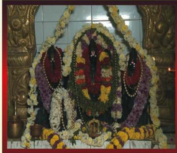
Hanumat Sametha Seetha Rama Lakshmana